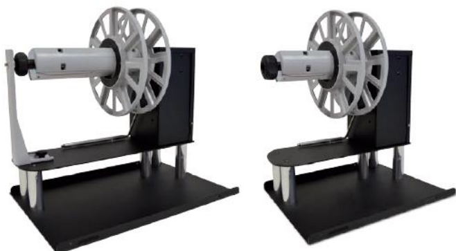
Dérouleur d'étiquettes C6500P / C6000P

Une alimentation externe 100 / 240VAC - 2,5A à 24V permet à un circuit électronique de fournir, à travers le bras de tension, le réglage automatique du sens de rotation et de la vitesse.