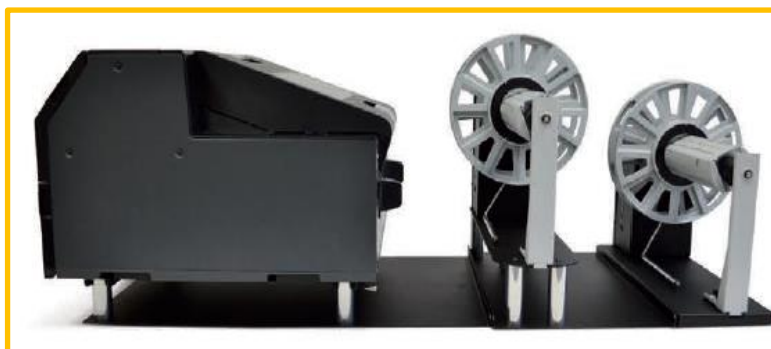
Dérouleur d'étiquettes / Ré-enrouleur d'étiquettes Imprimante non incluse

Le système Bobine à Bobine spécialement conçu pour l'imprimante d'étiquettes couleur Epson C6000P / C6500P peut gérer des rouleaux allant jusqu'à 220 mm (8,66 ") de large et ayant un diamètre extérieur allant jusqu'à 250 mm (10") sur un mandrin de 76mm.