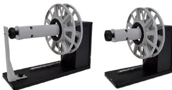
Ré-enrouleur d'étiquettes C6500P / C6000P

Utilisé pour augmenter la capacité du rouleau d'entrée, il déroule automatiquement les rouleaux ayant uniquement des étiquettes face vers le haut.