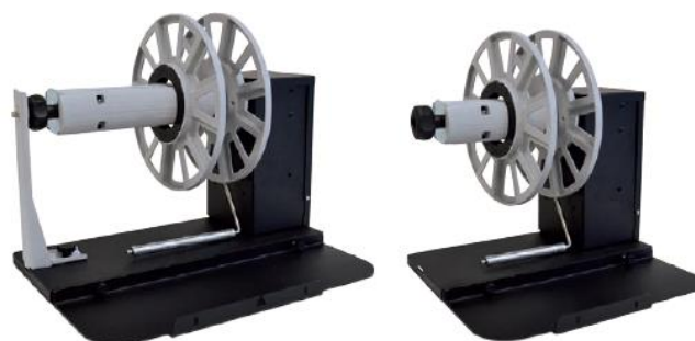
Ré-enrouleur d'étiquettes C6500 / C6000