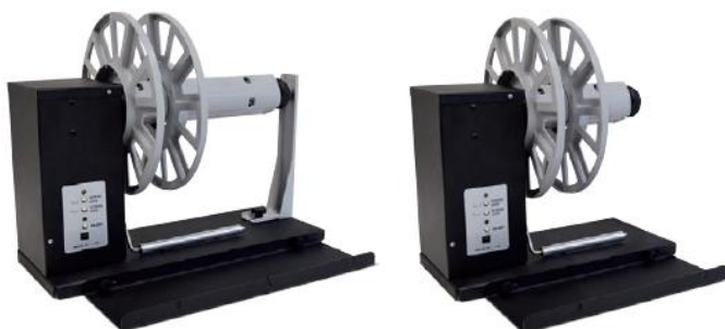
Dérouleur d'étiquettes C6500 / C6000

Une alimentation externe 100 / 240VAC - 2,5A à 24V permet à un circuit électronique de fournir, à travers le bras de tension, le réglage automatique du sens de rotation et de la vitesse.