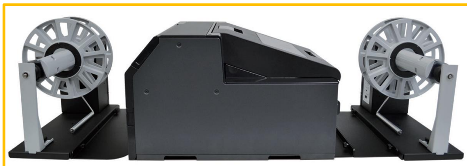
Dérouleur d'étiquettes / Ré-enrouleur d'étiquettes Imprimante non incluse

Le système Bobine à Bobine spécialement conçu pour l'imprimante d'étiquettes couleur Epson C6500 peut gérer des rouleaux allant jusqu'à 220 mm (8,66 ") de large et ayant un diamètre extérieur allant jusqu'à 250 mm (10") sur un mandrin de 76mm.