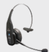
Casque Bluetooth VXI B350-XT