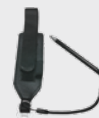
Dragonage (Inclus à l'achat)