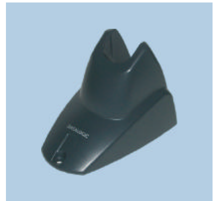
Support mains libres Heron™ avec socle en métal (disponible en option)