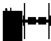
CAT-2 W9 Largeur 250 mm Diamètre bobine 300 mm