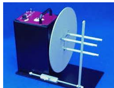
CAT2 ACH option APG

La conception du CAT-2 entièrement métallique et industrielle lui permet de trouver sa place dans tous les environnements. Ses pieds antidérapants empêchent tout mouvement de l'unité pendant son fonctionnement, sa base métallique de forte épaisseur autorise une fixation rigide pour l'intégrer dans des robots ou automates. Le CAT-2 est ses options bénéficient d'une garantie de 3 ans.