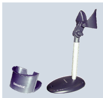
SPC Heron™ G et STD Heron™ G